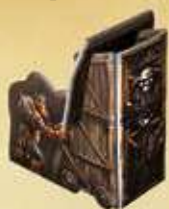
L'Engin de Siège

3. Placez à proximité du plateau les six Menaces :