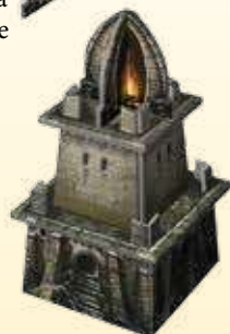
Le Temple achevé

Quelques récits évoquent de puissants Engins de Siège et Catapultes. D'autres racontent que les Héros ont détruit le Temple Noir, pour en finir avec sa magie maléfique.