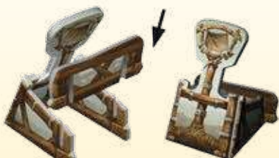
La Catapulte achevée