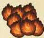
8 x Feu