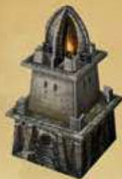
Le Temple Noir