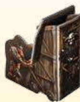
L'Engin de Siège achevé

Et une fresque murale des Soldats Nains semble représenter Irlok, la Créature du Lac Secret, quittant ses profondeurs pour attaquer Andor. Irlok est une légende, un monstre de contes de fée, qui n'a probablement jamais existé, mais qui sait ce qui a pu réellement se passer à cette époque troublée ?